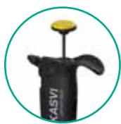
03 Micropipetas Kasvi Premium Black