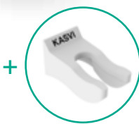
03 Suportes para Micropipetas