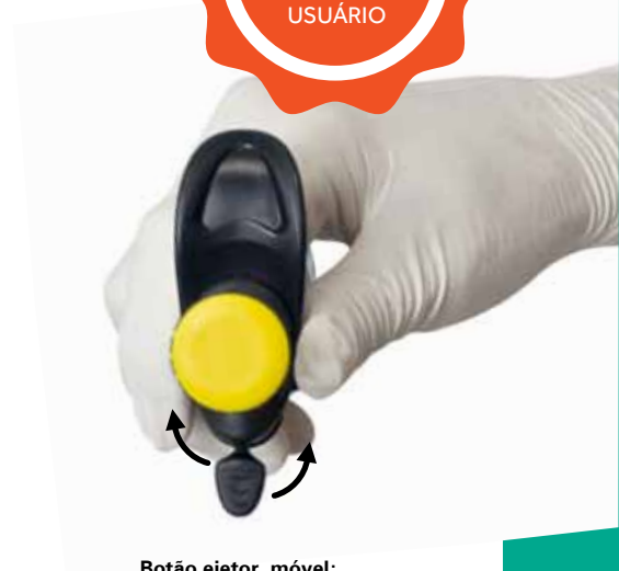
Botão ejetor móvel: esquerda, direita e central

Imagens meramente ilustrativas. Produtos não passíveis de regulamentação na ANVISA.